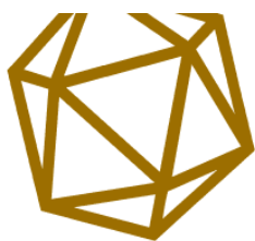
Liceo Scientifico Statale Stanislao Cannizzaro